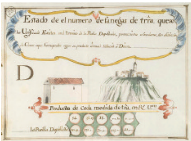
Estado de la Letra D de Eclesiásticos de La Puebla Despoblada , 1752 (AHPGU).

El real decreto de 1749 llevaba aneja una Instrucción formada por 41 capítulos, que explicaban con todo pormenor la forma de proceder, lo que había que averiguar, cómo fijar las utilidades y rentas y los libros oficiales en que todo debía quedar recogido y formalizado. La averiguación se desarrollaría a dos niveles, individual y municipal. El nivel individual queda bien definido al señalarse que debía declarar y ser objeto de averiguación toda persona, física o jurídica, que fuera titular, activo o pasivo, de cualquier bien, derecho o carga, fuera cual fuese su condición estamental o estado civil. En cuanto a las personas jurídicas, no se exceptuaba ninguna. El nivel muni-