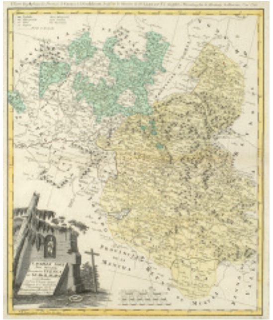
Mapa de la provincia de Guadalajara en el siglo XVIII, levantado por Tomás López, Geógrafo de Su Magestad, 1781 (AHPGU).