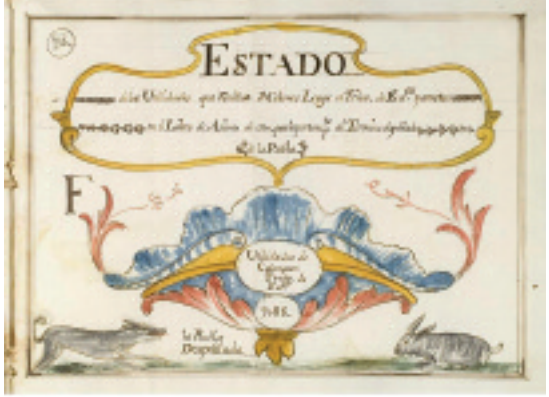
Estado F, con las utilidades de los colonos que explotaban tierras de eclesiásticos en el término de La Puebla Despoblada, 1752 (AHPGU).

icipal se centraría en la obtención de respuestas formales a un Interrogatorio constituido por 40 preguntas, referidas a datos globales del pueblo, para adquirir noticias de tipo general o específico. En cuanto a la riqueza averiguada, se organizaría en dos ramos: el de lo real (bienes y derechos)