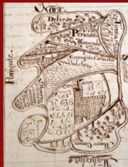
Dibujo del término de Congostrina (1752), recogido en sus Respuestas generales (AHPGU)

Consejería de Cultura de la Junta de Comunidades de Castilla-La Mancha Museo de Guadalajara Ayuntamiento de Guadalajara