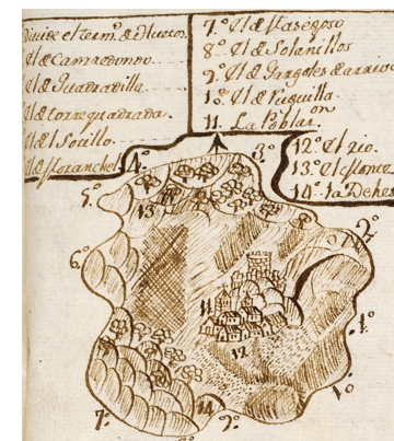
TERMINO MUNICIPAL DE ESCAMILLA Polígono Nº 14 (HF 2º)